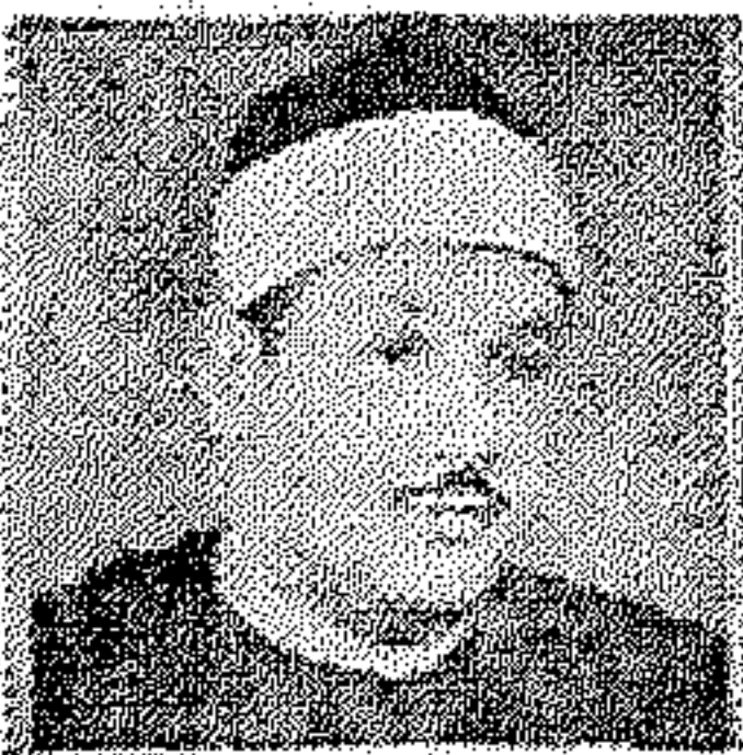
الشيخ محمود علي البنا

لأول مرة يتم تسجيل كامل للقرآن الكريم مجوداً بأصوات كبار القراء